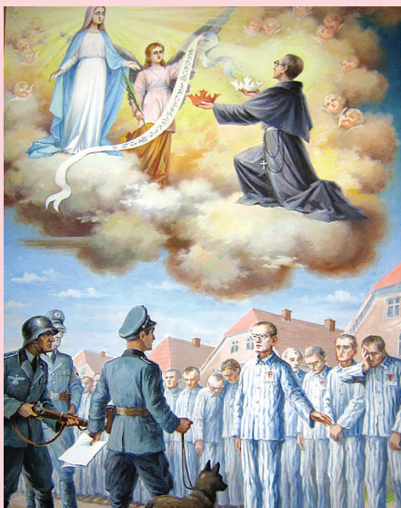
<성 막시밀리아노 마리아 콜베 신부 성화> 성 콜베 기념관, 나가사키, 일본

제2차 세계대전 중 독일은 폴란드를 점령하고 많은 사람들을 아우슈비츠 수용소에 감금했습니다.